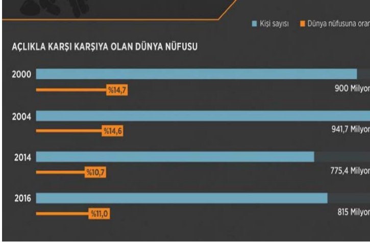
Tablo 1. Açlıkla Karşı Karşıya Olan Dünya Nüfusu

Kaynak: https://www.aa.com.tr/tr/dunya/dunyada-aclik-yeniden-yukseliste/936027 (Erişim Tarihi: 30 / 07 / 2018).