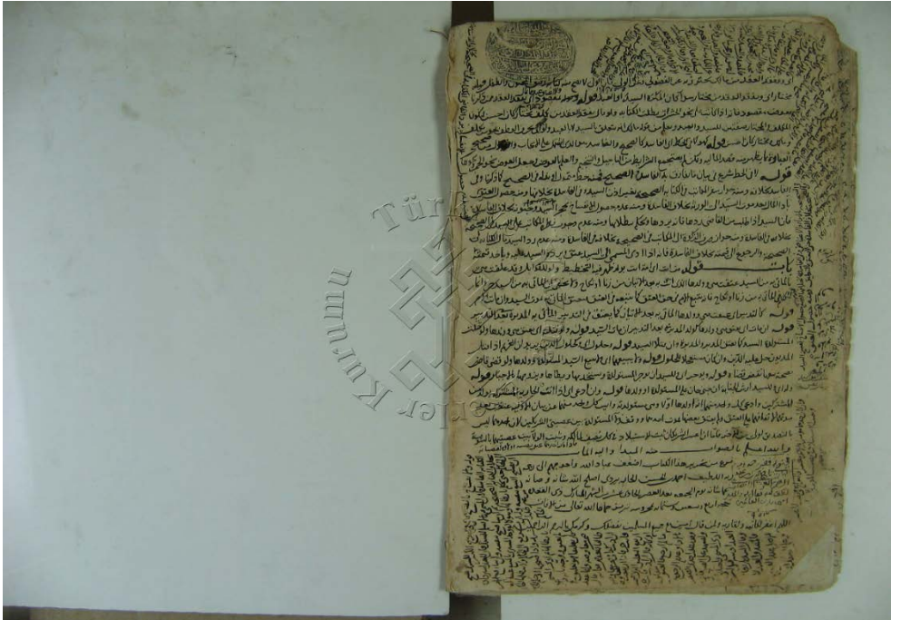
Ek-3 el-Emâlî fi'l-keşf 'ani'l-Hâvî'nin müellif hattı (Murad Molla 859