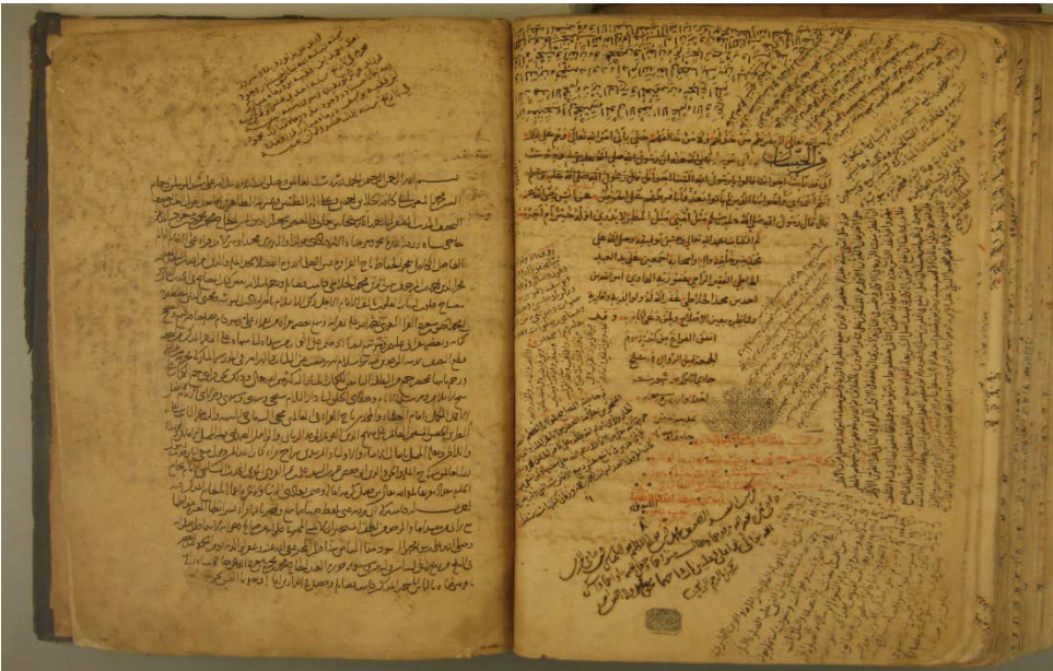
Ek-1 Hâşiye alâ Meşâbihî's-sünne'nin müellif hatlı nüshasının ilk-son varacağı (Köprülü Ktp. Fazıl Ahmed Paşa nr. 281)