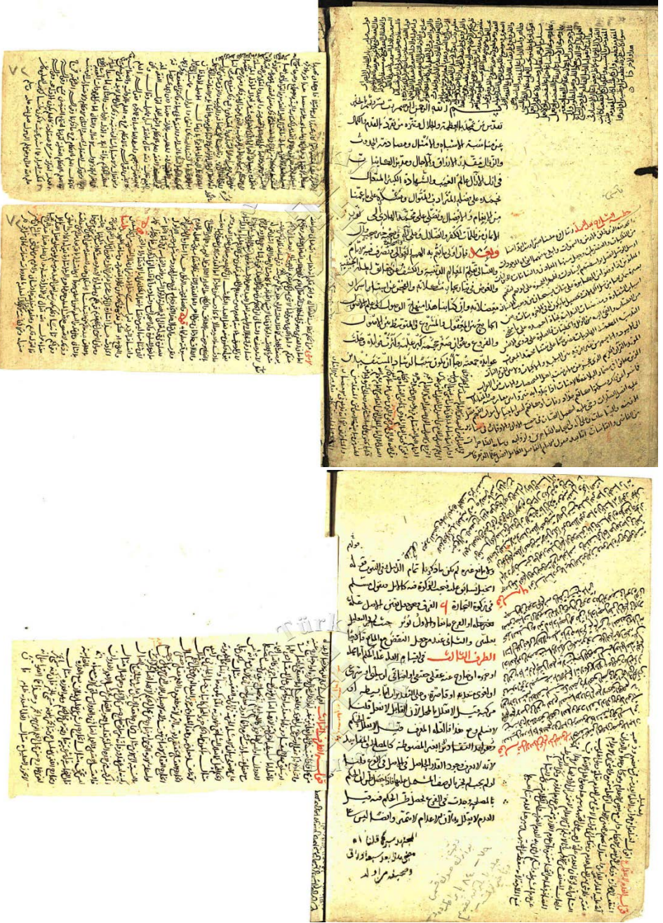
Ek-2 Siracü'l-vehhâc'ın müellif hatlı nüshasının ilk ve son varığı (Süleymaniye Ktp. Ayasofya nr. 1006)