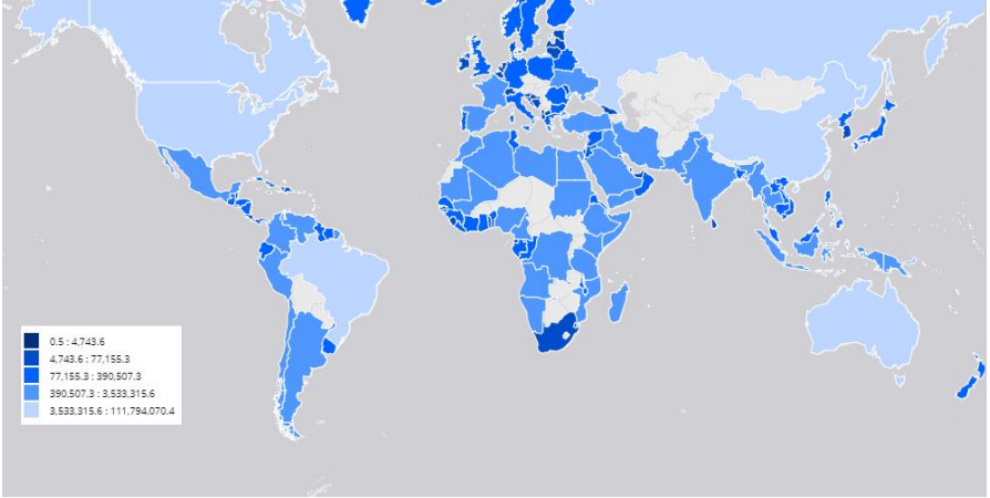
Resim.2 Kırsal Alan Dağılımı 32