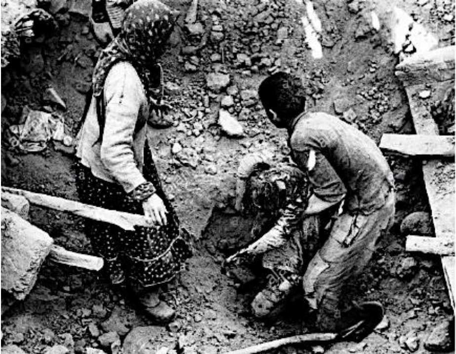
Resim 1. 1966 Varto Depreminden Bir Görünüm

Tablo 2 incelendiğinde 1900 yılından bu yana gerçekleşen depremler içinde en fazla can kaybına yol açan ilk üç depremin 2023 Kahramanmaraş depremleri, 1939 Erzincan depremi ve 1999 Marmara depremi olduğu görülür. Türkiye’de sadece bu üç depremde resmi rakamlara göre yaklaşık 100.000 kişi yaşamını yitirmiştir. Bununla birlikte, hayatını kaybeden insan sayısını sadece istatistiki bir veri olarak görmemek gerekir. Ölenlerin arasında bebekler, çocuklar, engelliler ve yaşlılar gibi savunmasız insanların olması ve daha da önemlisi bu insanların önceki depremlerdekine benzer ihmal ve hatalar sonucu ölmeleri Türkiye’deki depremlerde yaşanan kayıpları hem dramatik hale getirmekte hem de gelecekte olması beklenen depremlerde yaşanabilecek can kayıplarının çokluğu konusunda endişe yaratmaktadır.