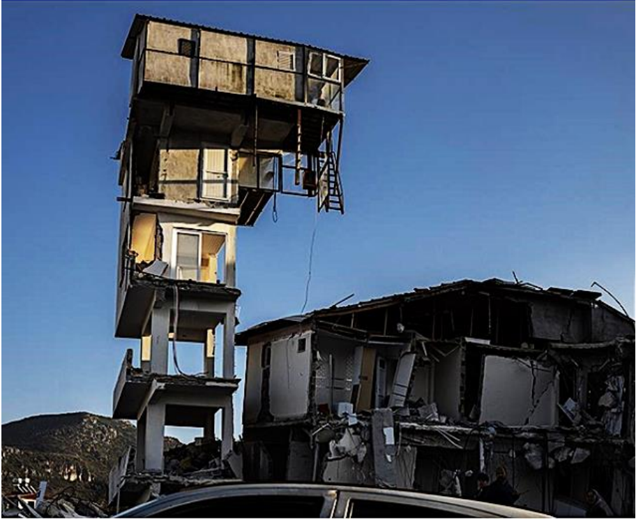
Resim 2. 2023 Kahramanmaraş Depreminden Bir Görünüm