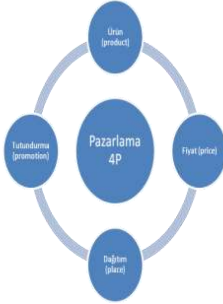
Şekil 1.2. Pazarlamanın 4P'si

Pazarlama Karması olarak adlandırılan 4P kavramları şu şekilde açıklanabilir(Karaaslan, 2019; Ilgaz Sümer ve Eser, 2006; Kotler, 1997; Zengin Demirbilek, 2021; Bulunmaz, 2016):