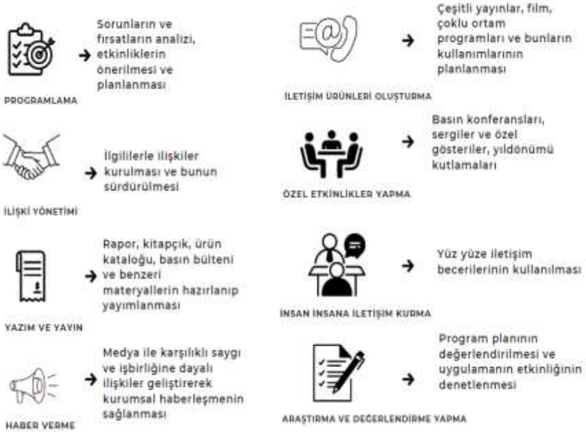
Şekil 1.1. Halkla İlişkilerin Temel Fonksiyonları

Halkla ilişkilerin birçok fonksiyonun olduğu bilinmektedir. İşletmeler de bu fonksiyonları birtakım amaçlar dahilinde kullanmaktadır. İşletmelerin halkla ilişkileri kullanma amaçları şu şekilde sayılabilir (Tosun, 2000. Akt: Zengin, 2010):