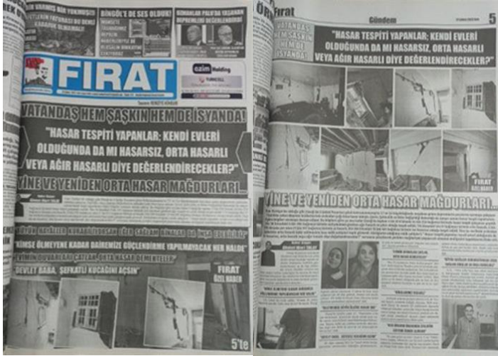
Şekil 13. Elazığ Fırat Gazetesi, 21 Şubat 2023, Sayfa 1-5.

oluşturma ve toplumsal dayanışma sağlama kapasitesini göstermektedir.