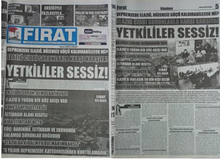
Şekil 27. Elazığ Fırat Gazetesi, 9 Mart 2023, Sayfa 1-5.

Asrın felaketi olarak adlandırılan 6 Şubat Kahramanmaraş depremlerine ilişkin Elazığ Fırat Gazetesi'nde yetkililerin eksiklikleri üzerine manşetten tam sayfa haber yapılmış, yapılan haber gazetenin manşet için ayrılan 5. Sayfasında da detaylı bir şekilde tam sayfa olarak verilmiştir (Şekil 27).