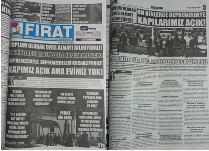
Şekil 15. Elazığ Fırat Gazetesi, 23 Şubat 2023, Sayfa 1-5.

Asrın felaketi olarak adlandırılan 6 Şubat Kahramanmaraş depremlerine ilişkin Elazığ Fırat Gazetesi'nde toplumsal dayanışma ve farkındalık oluşturma üzerine manşetten tam sayfa haber yapılmış, yapılan haber gazetenin manşet için ayrılan 5. Sayfasında da detaylı bir şekilde tam sayfa olarak verilmiştir (Şekil 15).