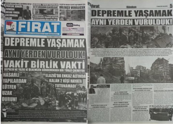
Şekil 2. Elazığ Fırat Gazetesi, 8 Şubat 2023, Sayfa 1-5.

Fırat Gazetesi, “Depremle Yaşamak! Aynı Yerden Vurulduk” başlıklı bu haberiyle, afet haberciliğinin yerel kamuoyu oluşumundaki kritik rolünü bir kez daha ortaya koymuştur. Haberin, bilgi aktarımı, farkındalık yaratma, dayanışma ruhunu pekiştirme ve toplumsal sorunlara dikkat çekme gibi birden fazla boyutta etkili olduğu görülmektedir. Yerel medyanın bu gibi kriz anlarında oynadığı rolün, sadece bilgilendirme ile sınırlı kalmayıp toplumsal dayanışmayı da desteklediği açıktır.