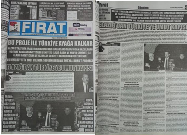
Şekil 8. Elazığ Fırat Gazetesi, 15 Şubat 2023, Sayfa 1-5.

Fırat Gazetesi, 15 Şubat 2023 tarihli haberiyle, afet haberciliği kapsamında kalkınma projelerinin tanıtılmasına ve toplumsal dayanışmanın teşviki için kamuoyu oluşturmaya önemli bir katkı sağlamıştır.