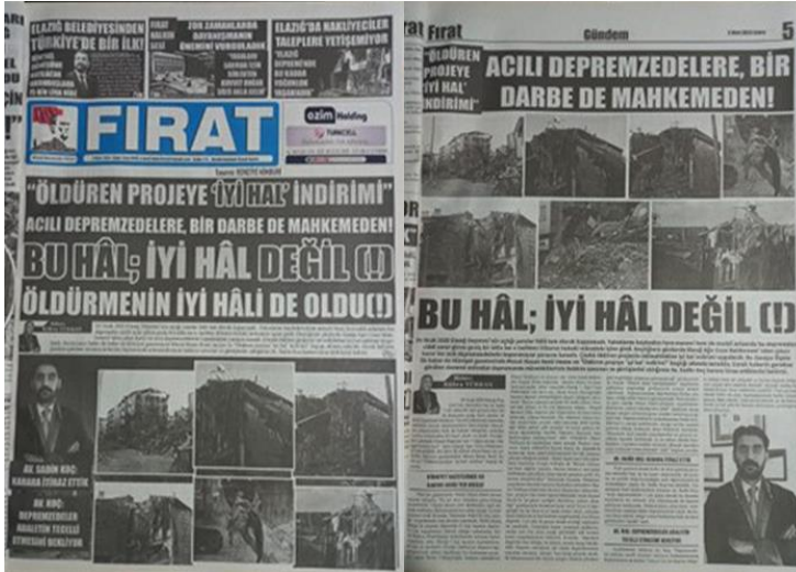
Şekil 22. Elazığ Fırat Gazetesi, 3 Mart 2023, Sayfa 1-5.

Fırat Gazetesi'nin “Bu Hâl; İyi Hâl Değil!” başlıklı haberi, afet haberciliğinin toplumsal adalet ve hesap verebilirlik sağlama konusundaki önemini ortaya koymaktadır. Bu haber, afetlerin hukuki ve toplumsal boyutlarını şeffaf bir şekilde aktararak kamuoyunun bilinçlendirilmesi anlamında bir rol oynamaktadır.