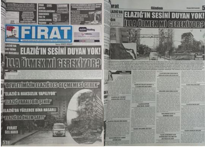
Şekil 9. Elazığ Fırat Gazetesi, 16 Şubat 2023, Sayfa 1-5.

toplumsal sorunlara dikkat çekme görevini başarıyla yerine getirmiştir.