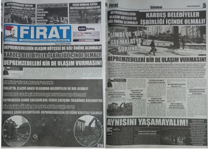
Şekil 29. Elazığ Fırat Gazetesi, 11 Mart 2023, Sayfa 1-5.

Asrın felaketi olarak adlandırılan 6 Şubat Kahramanmaraş depremlerine ilişkin Elazığ Fırat Gazetesi'nde Malatyalı depremzedelerin yaşadığı ulaşım sorunu üzerine manşetten tam sayfa haber yapılmış, yapılan haber gazetenin manşet için ayrılan 5. Sayfasında da detaylı bir şekilde tam sayfa olarak verilmiştir (Şekil 29).