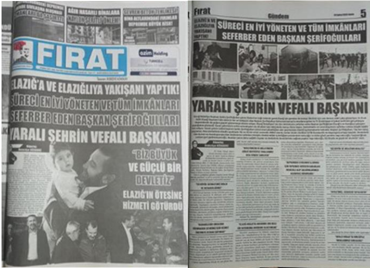
Şekil 16. Elazığ Fırat Gazetesi, 24 Şubat 2023, Sayfa 1-5.

Afet haberciliği, sadece olayları rapor etmekle sınırlı kalmaz; toplumu bir araya getirme, dayanışma yaratma ve gelecekteki felaketlere karşı bilinç oluşturma gibi kritik bir misyona sahiptir. Fırat Gazetesi'nin ilgili haberinin bu misyonu nasıl yerine getirdiği tartışmalıdır. Haberdeki dil, toplumsal dayanışmayı teşvik ederken, yerel yönetimin çalışmalarına övgü yapmış ve kamuoyunda pozitif bir algı yaratmaya çalışmıştır.