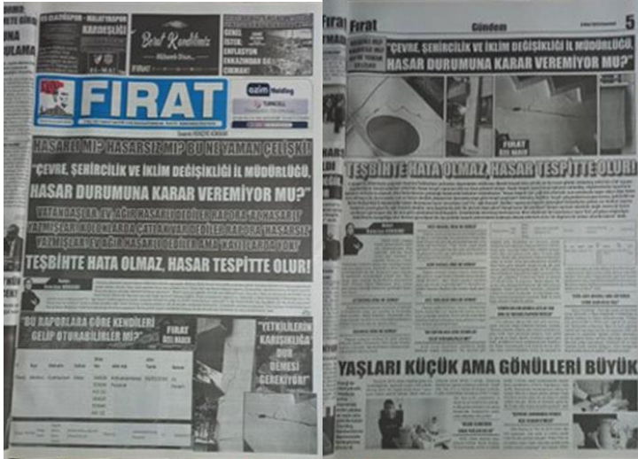
Şekil 24. Elazığ Fırat Gazetesi, 6 Mart 2023, Sayfa 1-5.

Hasar tespit süreçlerinin şeffaf bir şekilde yürütülmesi ve vatandaşların hızla bilgilendirilmesinin sağlanması, eski ve hasarlı binaların yenilenmesi için kapsamlı bir kentsel dönüşüm stratejine olan ihtiyaç haberde vurgulanmıştır.