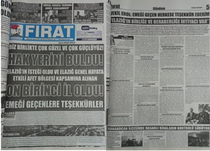
Şekil 10. Elazığ Fırat Gazetesi, 17 Şubat 2023, Sayfa 1-5.

Asrın felaketi olarak adlandırılan 6 Şubat Kahramanmaraş depremlerine ilişkin Elazığ Fırat Gazetesi'nde şehrin afet bölgesi ilan edilme süreci ele alınarak manşetten tam sayfa haber yapılmış, yapılan haber gazetenin manşet için ayrılan 5. Sayfasında da detaylı bir şekilde tam sayfa olarak verilmiştir (Şekil 10).