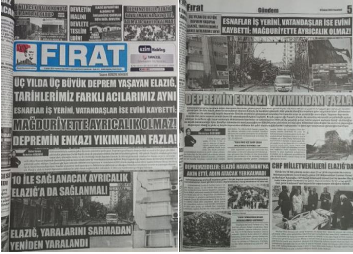
Şekil 6. Elazığ Fırat Gazetesi, 13 Şubat 2023, Sayfa 1-5.

Asrın felaketi olarak adlandırılan 6 Şubat Kahramanmaraş depremlerine ilişkin Elazığ Fırat Gazetesi'nde şehrin yaşamış olduğu üç büyük depremin yaratmış olduğu sosyoekonomik etkiler manşetten tam sayfa haber yapılmış, yapılan haber gazetenin manşet için ayrılan 5. Sayfasında da detaylı bir şekilde tam sayfa olarak verilmiştir (Şekil 6).