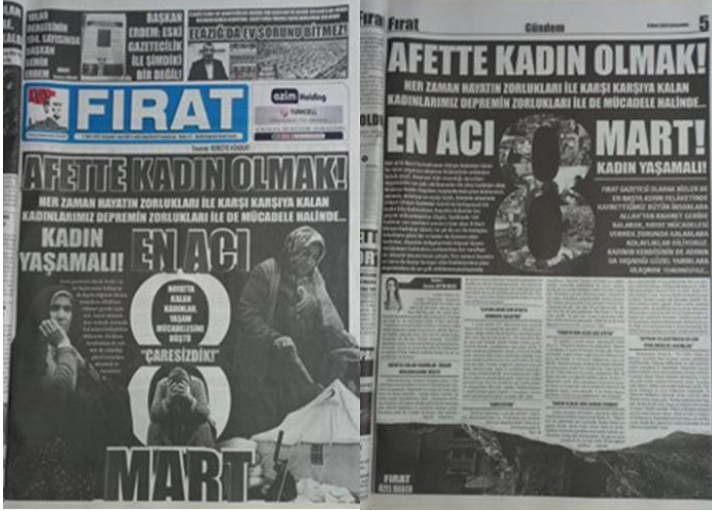
Şekil 26. Elazığ Fırat Gazetesi, 8 Mart 2023, Sayfa 1-5.

Afet sonrası kadınların karşılaştığı sorunları ele alan bu haber, yalnızca bir gazetecilik örneği değil, aynı zamanda toplumsal dayanışma ve farkındalık yaratma çağrısıdır.