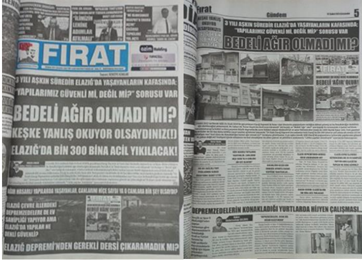
Şekil 14. Elazığ Fırat Gazetesi, 22 Şubat 2023, Sayfa 1-5.

Asrın felaketi olarak adlandırılan 6 Şubat Kahramanmaraş depremlerine ilişkin Elazığ Fırat Gazetesi'nde yetkililerin çözüm odaklı girişimlerindeki yetersizlikler manşetten tam sayfa haber yapılmış, yapılan haber gazetenin manşet için ayrılan 5. Sayfasında da detaylı bir şekilde tam sayfa olarak verilmiştir (Şekil 14).