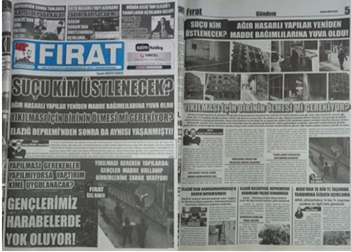
Şekil 28. Elazığ Fırat Gazetesi, 10 Mart 2023, Sayfa 1-5.

sorunlar hakkında bilgilendirme konusunda dikkate değerdir.