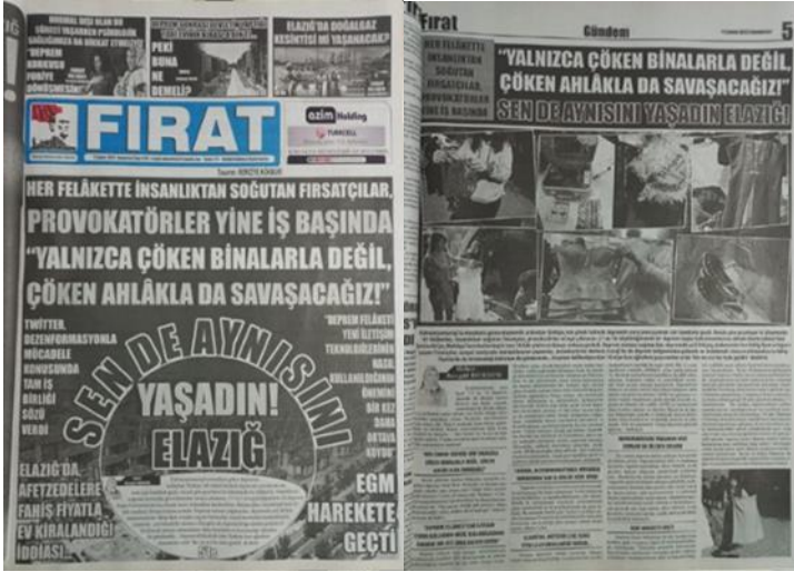
Şekil 5. Elazığ Fırat Gazetesi, 11 Şubat 2023, Sayfa 1-5.

Fırat Gazetesi, bu haberle afet haberciliği sürecinde toplumsal ahlakı sorgulayan ve dayanışmanın önemine dikkat çeken habercilik anlayışıyla önemli bir rol oynamıştır. Bu tür haberler, halkın manipülatif bilgilere karşı daha dirençli olmasını sağlarken toplumsal dayanışmanın devamı için farkındalık yaratır.