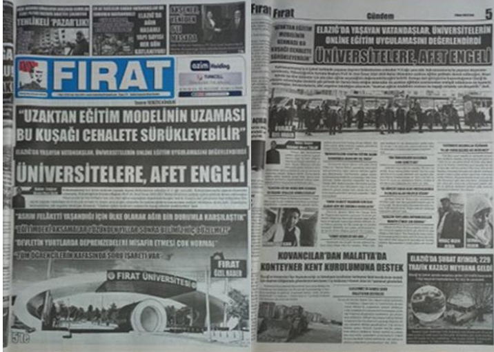
Şekil 25. Elazığ Fırat Gazetesi, 7 Mart 2023, Sayfa 1-5.

“Elazığ’da Yaşayan Vatandaşlar, Üniversitelerin Online Eğitim Uygulamasını Değerlendirdi” başlıklı haber, afet sonrası eğitim politikalarına yönelik toplumsal algıyı anlamak için değerli bir kaynak sunmaktadır. Bu haberin kamuoyunun endişelerini görünür kılmadaki rolü, kriz dönemlerinde doğru ve etkili politika geliştirilmesi açısından önem taşımaktadır.