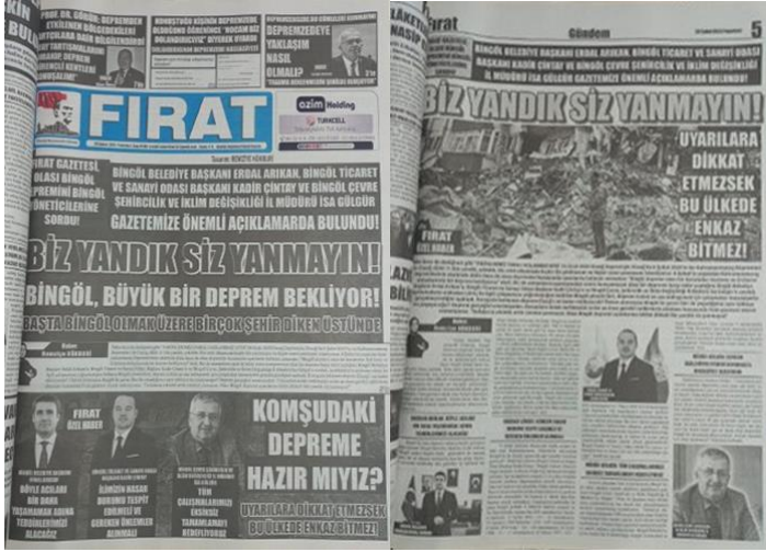
Şekil 12. Elazığ Fırat Gazetesi, 20 Şubat 2023, Sayfa 1-5.

Asrın felaketi olarak adlandırılan 6 Şubat Kahramanmaraş depremlerine ilişkin Elazığ Fırat Gazetesi'nde afetler konusunda halkın bilinçlendirilmesi amacıyla uzman görüşleri manşetten tam sayfa haber yapılmış, yapılan haber gazetenin manşet için ayrılan 5. Sayfasında da detaylı bir şekilde tam sayfa olarak verilmiştir (Şekil 12).