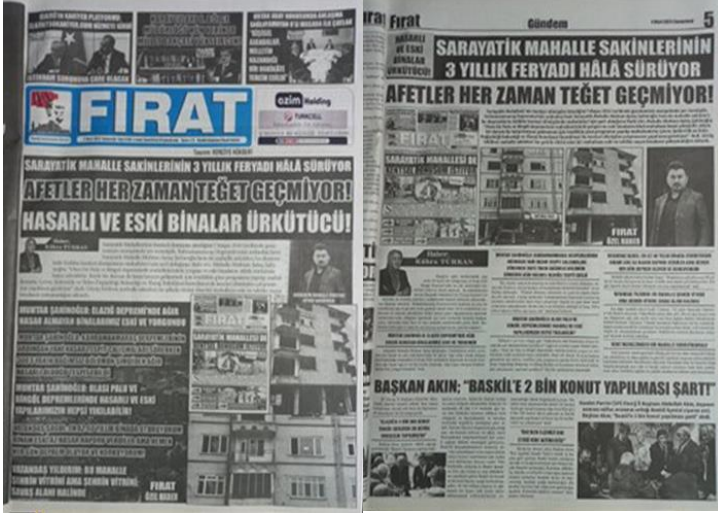
Şekil 23. Elazığ Fırat Gazetesi, 4 Mart 2023, Sayfa 1-5.

Asrın felaketi olarak adlandırılan 6 Şubat Kahramanmaraş depremlerine ilişkin Elazığ Fırat Gazetesi'nde mahalle sakinlerinin kentsel dönüşüm taleplerini yetkililere iletme çabaları üzerine manşetten tam sayfa haber yapılmış, yapılan haber gazetenin manşet için ayrılan 5. Sayfasında da detaylı bir şekilde tam sayfa olarak verilmiştir (Şekil 23).