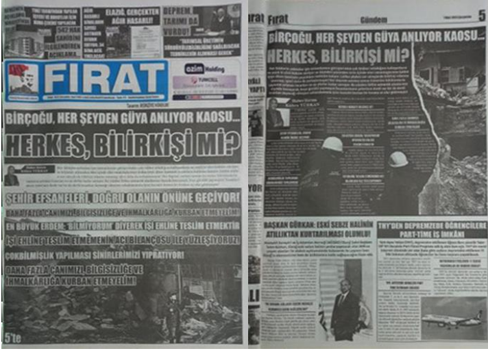
Şekil 20. Elazığ Fırat Gazetesi, 1 Mart 2023, Sayfa 1-5.

Asrın felaketi olarak adlandırılan 6 Şubat Kahramanmaraş depremlerine ilişkin Elazığ Fırat Gazetesi'nde uzman olmayan kişilerin afet sonrasındaki spekülatif yorumları üzerine manşetten tam sayfa haber yapılmış, yapılan haber gazetenin manşet için ayrılan 5. Sayfasında da detaylı bir şekilde tam sayfa olarak verilmiştir (Şekil 20).