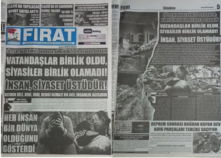
Şekil 21. Elazığ Fırat Gazetesi, 2 Mart 2023, Sayfa 1-5.

Asrın felaketi olarak adlandırılan 6 Şubat Kahramanmaraş depremlerine ilişkin Elazığ Fırat Gazetesi'nde siyasi uzlaşmazlıkların kriz ortamlarındaki olumsuz etkileri üzerine manşetten tam sayfa haber yapılmış, yapılan haber gazetenin manşet için ayrılan 5. Sayfasında da detaylı bir şekilde tam sayfa olarak verilmiştir (Şekil 21).