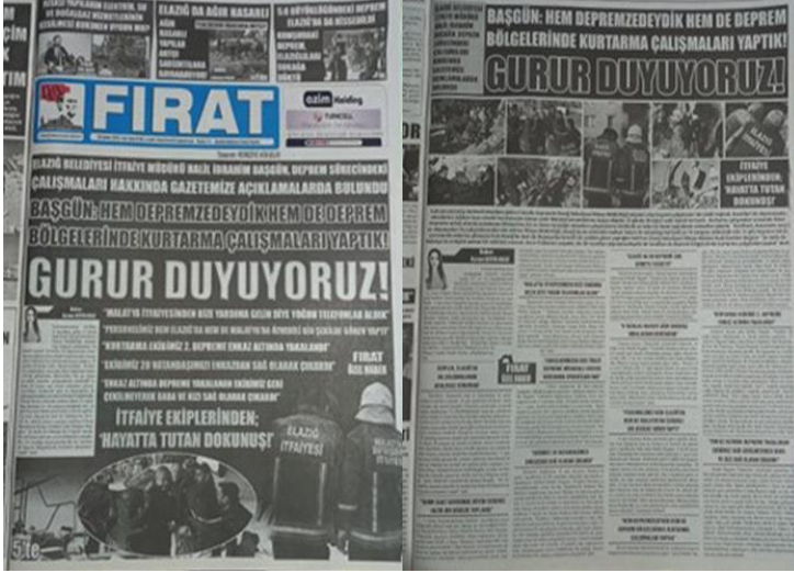
Şekil 19. Elazığ Fırat Gazetesi, 28 Şubat 2023, Sayfa 1-5.

şeffaf bir biçimde aktarmak suretiyle toplumsal dayanışma ve güven oluşturmada bir aracı işlevi görmektedir.