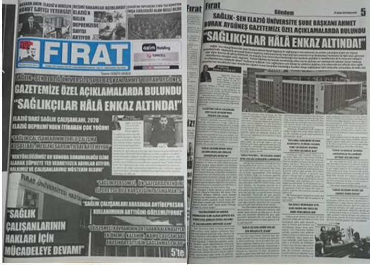
Şekil 17. Elazığ Fırat Gazetesi, 25 Şubat 2023, Sayfa 1-5.

Asrın felaketi olarak adlandırılan 6 Şubat Kahramanmaraş depremlerine ilişkin Elazığ Fırat Gazetesi'nde depremde sağlık çalışanlarının kritik rolü manşetten tam sayfa haber yapılmış, yapılan haber gazetenin manşet için ayrılan 5. Sayfasında da detaylı bir şekilde tam sayfa olarak verilmiştir (Şekil 17).