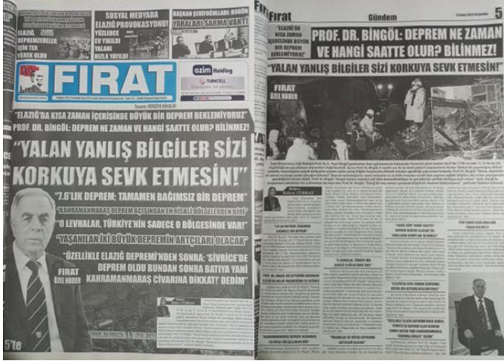
Şekil 3. Elazığ Fırat Gazetesi, 9 Şubat 2023, Sayfa 1-5.

önlemek hem de toplumu bilinçlendirmek için etkili bir araç olarak karşımıza çıkmaktadır.