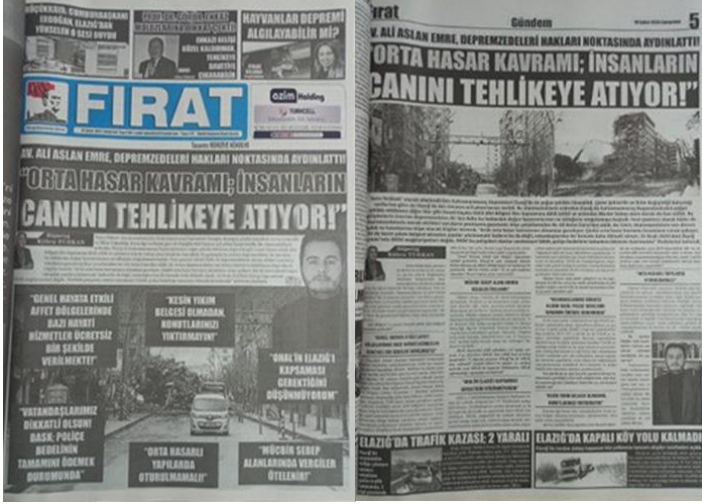
Şekil 11. Elazığ Fırat Gazetesi, 18 Şubat 2023, Sayfa 1-5.

Asrın felaketi olarak adlandırılan 6 Şubat Kahramanmaraş depremlerine ilişkin Elazığ Fırat Gazetesi'nde depremezelerin hakları ve dikkat etmeleri gereken noktalara yönelik bilgiler manşetten tam sayfa haber yapılmış, yapılan haber gazetenin manşet için ayrılan 5. Sayfasında da detaylı bir şekilde tam sayfa olarak verilmiştir (Şekil 11).