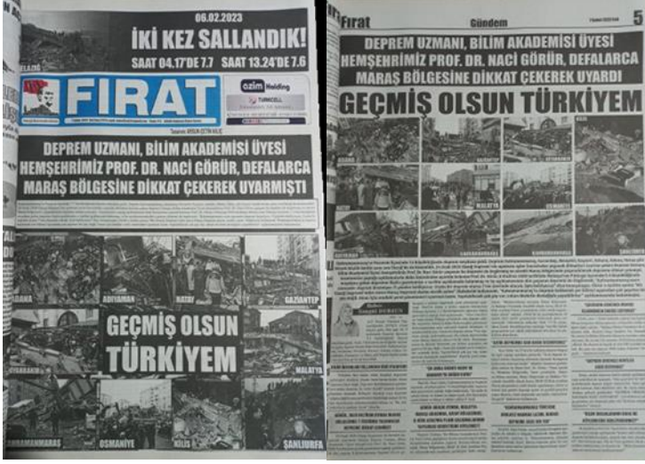
Şekil 1. Elazığ Fırat Gazetesi, 7 Şubat 2023, Sayfa 1-5.

Asrın felaketi olarak adlandırılan 6 Şubat Kahramanmaraş depremlerine ilişkin Elazığ Fırat Gazetesi'nde deprem uzmanının uyarıları üzerine manşetten tam sayfa haber yapılmış, yapılan haber gazetenin manşet için ayrılan 5. Sayfasında da detaylı bir şekilde tam sayfa olarak verilmiştir (Şekil 1).