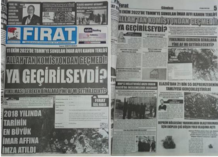
Şekil 7. Elazığ Fırat Gazetesi, 14 Şubat 2023, Sayfa 1-5.

Asrın felaketi olarak adlandırılan 6 Şubat Kahramanmaraş depremlerine ilişkin Elazığ Fırat Gazetesi'nde imar affı politikalarının yapı stokunun güvenliği üzerine manşetten tam sayfa haber yapılmış, yapılan haber gazetenin manşet için ayrılan 5. Sayfasında da detaylı bir şekilde tam sayfa olarak verilmiştir (Şekil 7).