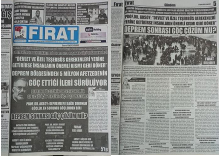
Şekil 18. Elazığ Fırat Gazetesi, 27 Şubat 2023, Sayfa 1-5.

haberciliğindeki kritik rolünü bir kez daha ortaya koymaktadır.