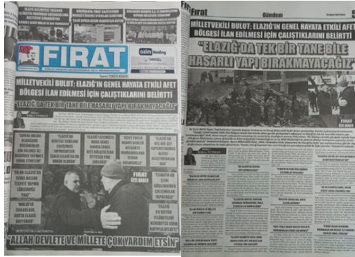
Şekil 4. Elazığ Fırat Gazetesi, 10 Şubat 2023, Sayfa 1-5.

Fırat Gazetesi, "Milletvekili Bulut; Elazığ'ın Genel Hayata Etkili Afet Bölgesi İlan Edilmesi İçin Çalıştıklarını Belirtti" haberiyle toplumsal bilgi aktarımı, dayanışma teşviki ve depreme karşı bilinç oluşturma alanlarında bir görev üstlenmiştir. Yerel medyanın afet haberciliği kapsamında etik ilkeleri ve şeffaflığı ön planda tutarak hareket etmesi, toplumun dayanıklılığını artıran bir strateji olarak değerlendirilmelidir.