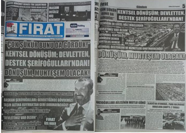
Şekil 30. Elazığ Fırat Gazetesi, 13 Mart 2023, Sayfa 1-5.

Asrın felaketi olarak adlandırılan 6 Şubat Kahramanmaraş depremlerine ilişkin Elazığ Fırat Gazetesi'nde kentsel dönüşüm çalışmaları ve belediye destekleri üzerine manşetten tam sayfa haber yapılmış, yapılan haber gazetenin manşet için ayrılan 5. Sayfasında da detaylı bir şekilde tam sayfa olarak verilmiştir (Şekil 30).